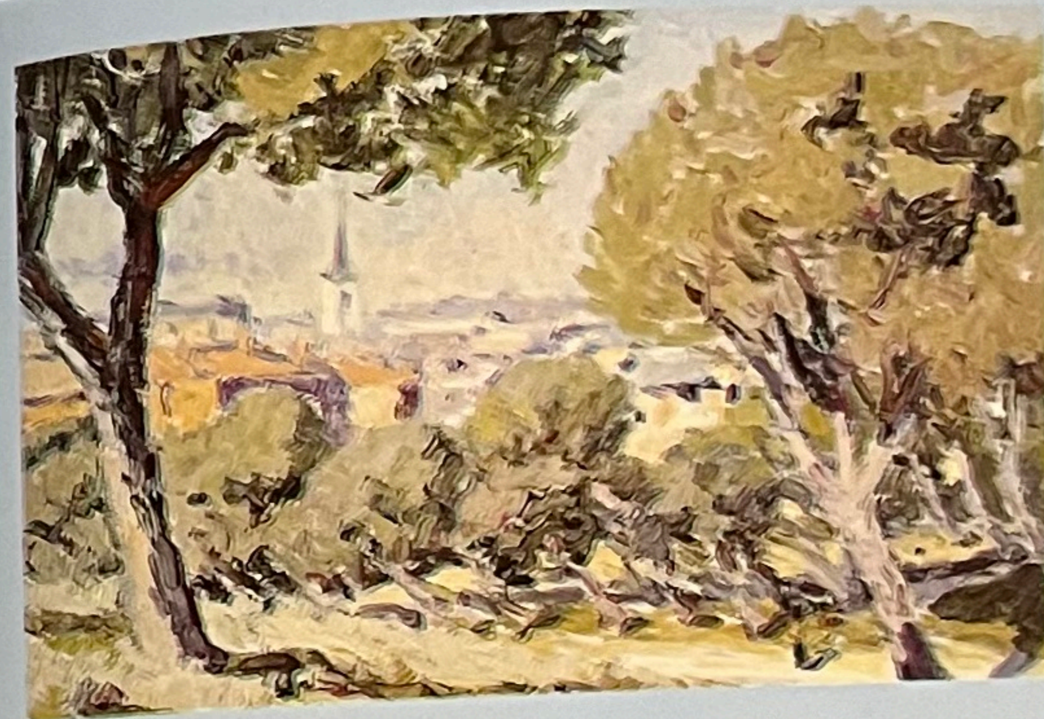
Pozuelo de Alarcón