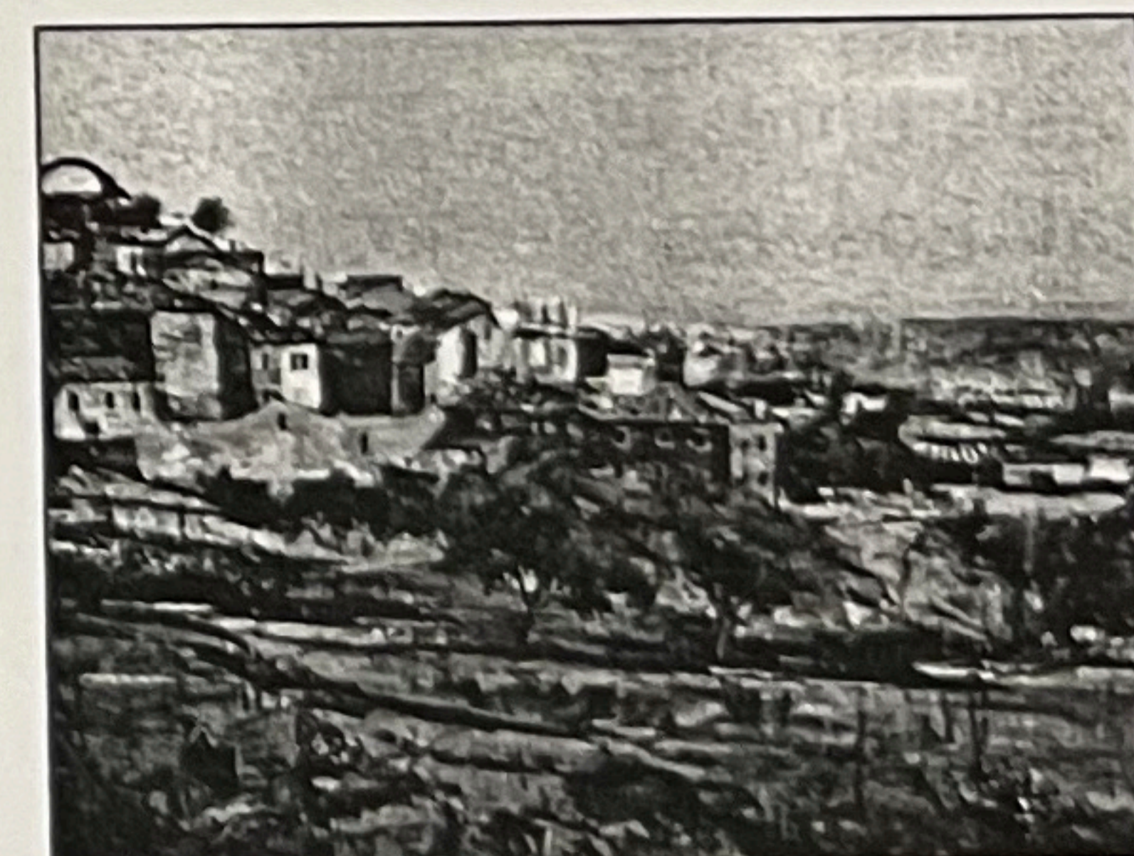
Segundo y Tercer premios del II Concurso de pintura