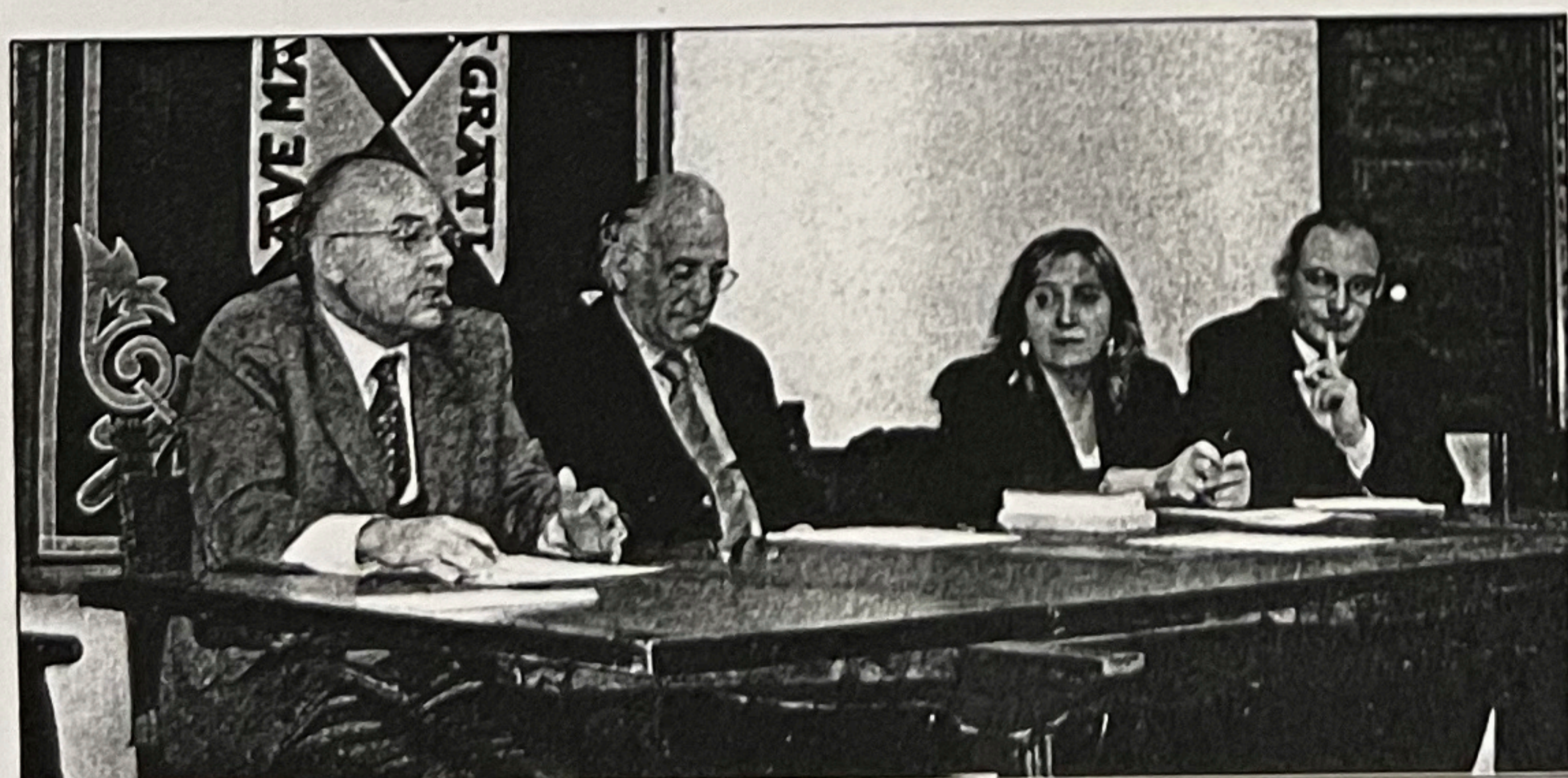
Mesa de la conferencia histórica