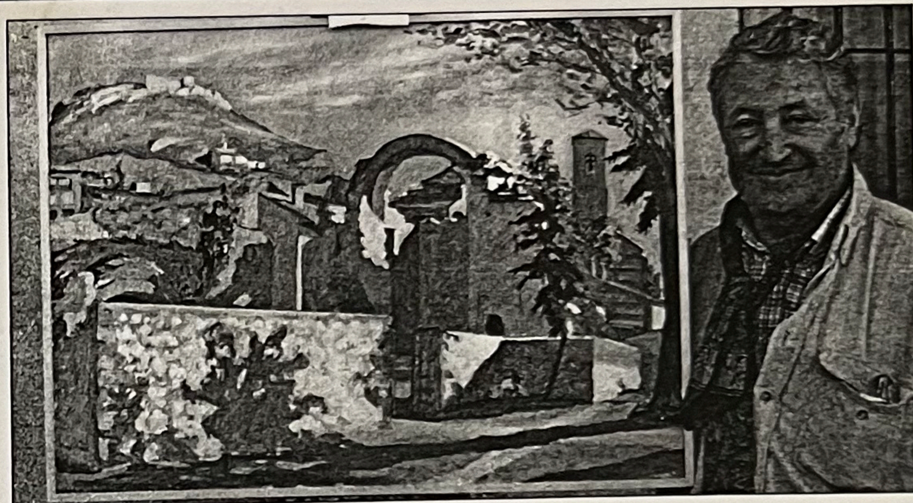
El autor junto al primer premio del II Concurso de pintura

la vida y de la muerte en el Libro de Buen Amor". Este acto contó con la colaboración de la Asociación de Amigos del Archivo Provincial de Guadalajara. Por último a última hora de la tarde se celebró VIII Concierto Otoñal de Música Medieval , en la Iglesia de San Juan, a cargo de Gregorio Paniagua con una aforo completo.